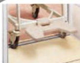
水まわり用車いすでもラクラク入れます

●3種類のユニット幅から組み合わせることができます。また、長さをカットできるので洗い場にぴったり納まります。大がかりな改装工事は不要です。