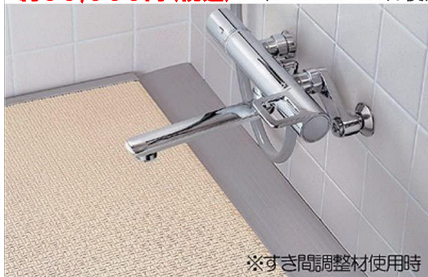
※すき間調整材使用時