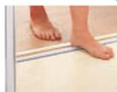
安心して歩けます